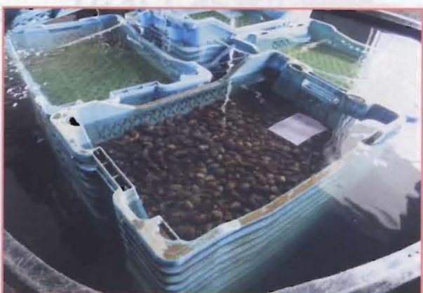
10 种子过後浸在水里2天2夜以提高其水份。