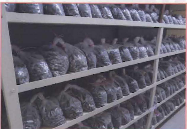
12 存库在冷气设备内的油棕种子。