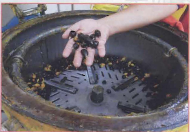
9 被分离出来的种子。