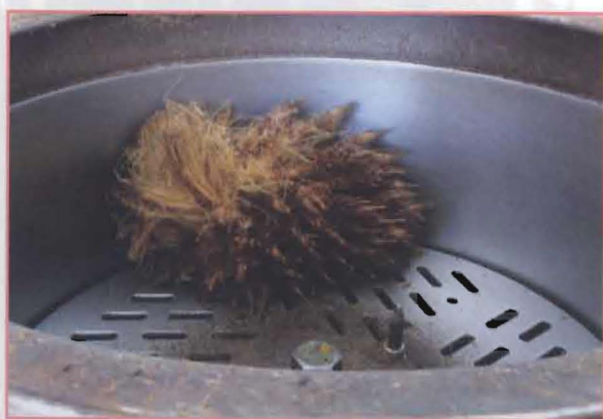
6 被分开出来的空果串摄影。