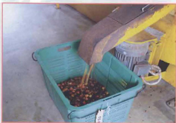
5 被分开出来的果实摄影。