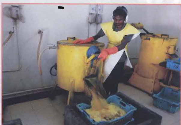
8 果实外层流出机外。