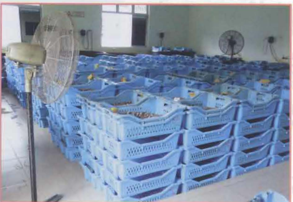
11 种子正在风乾处理。